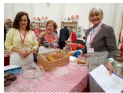
DANISH FAIR (tidligere kaldet SUMMER BASAR)

LØRDAG d. 12. MAJ Kl. 11 i Den Danske Kirke